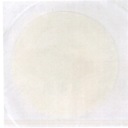
28 日間培養後試験片